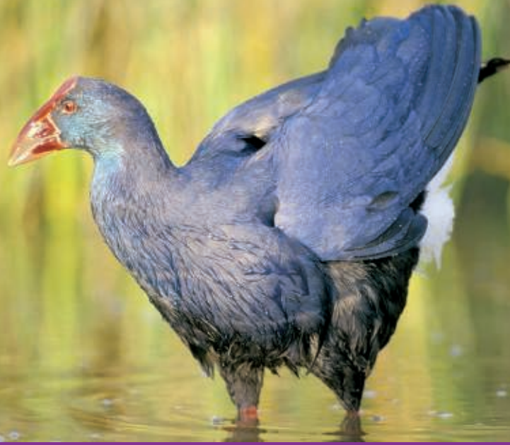
Porphyrio porphyrio

Un altre aspecte bàsic és el Programa de Seguiment i Suport a la Recerca, que inclou el seguiment ornitològic, el meteorològic, el de la vegetació, etc. El Parc natural de s'Albufera és també obert a la gent: turistes, famílies, naturalistes, fotògrafs, escolars i qualsevol altra persona que vulgui gaudir de la natura. Es disposa d'un centre de recepció, una exposició permanent, un conjunt d'itineraris, aguait, punts d'observació i publicacions en diverses llengües.