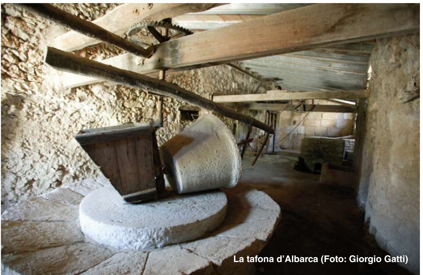
La tafona d'Albarca

A partir de les olives que es cullen a Albarca s'elabora oli d'oliva de producció ecològica, molt apreciat. Les olives es premsen fora de les finques, si bé resta encara en bon estat de conservació la tafona d'Albarca adossada a la part posterior de la casa dels amos.