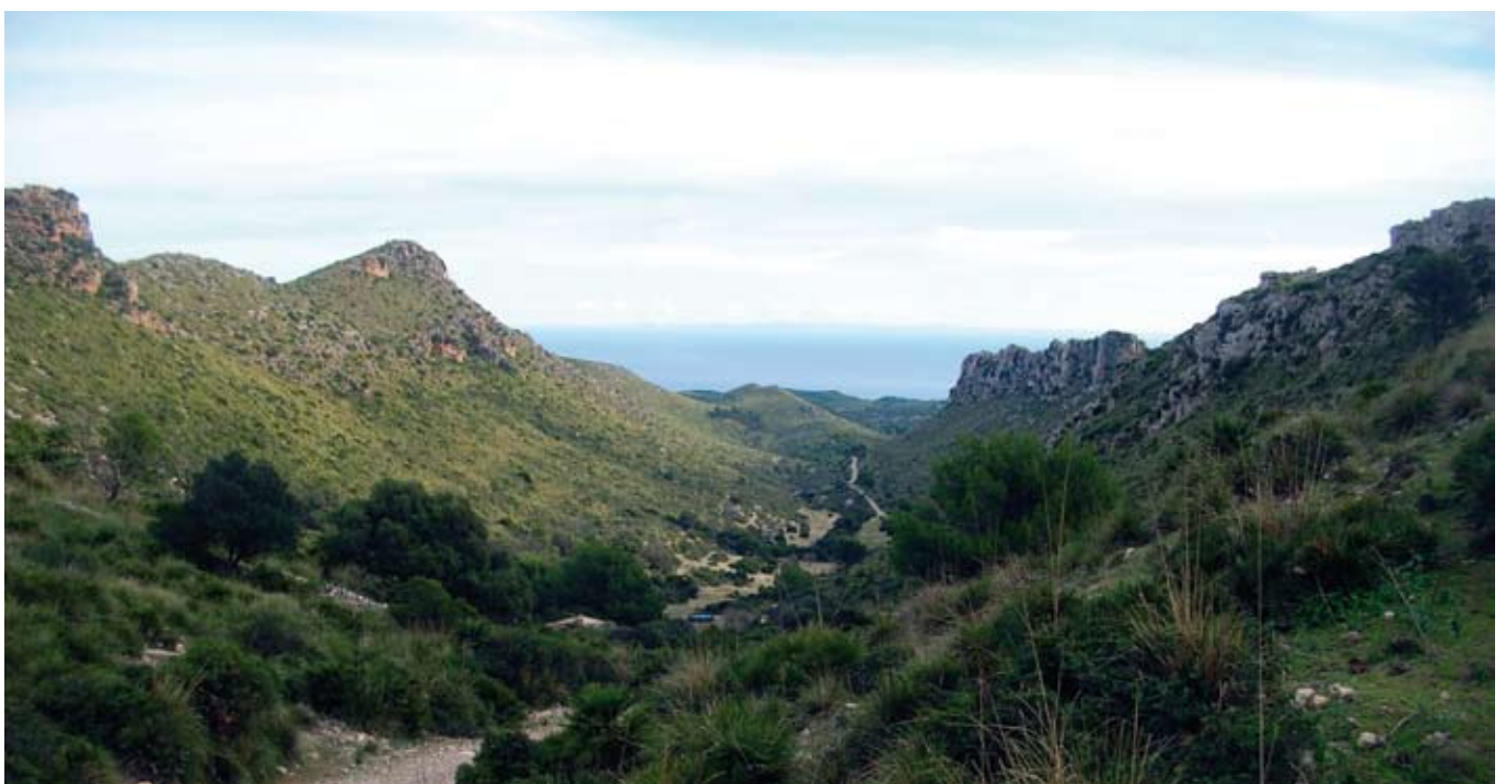
Panoràmica del camí d'Albarca