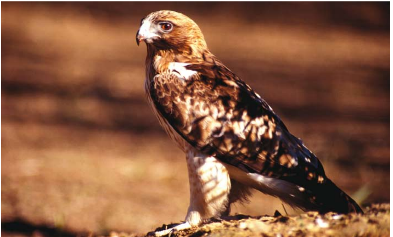
Esparver o àguila calçada

La presència d'aquests i d'altres rapinyaires, com la moixeta voltонера ( Neophron percnopterus ) i la milana ( Milvus milvus ), fan que el Parc natural de la Península de Llevant tengui un elevat interès faunístic.