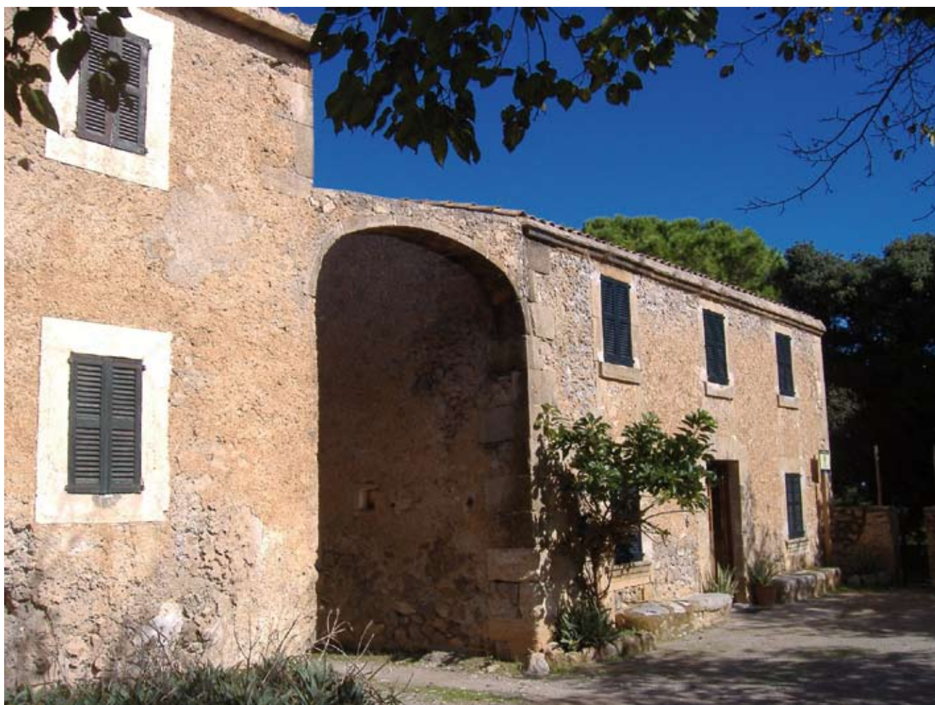
Cases d'Albarca, inclouen la casa dels amos i el refugi de s'Alzina

En arribar a l'encreuament senyalitzat agafam el camí de la dreta, que en molt pocs minuts ens du a Albarca. Just abans d'arribar a les cases veurem uns sestadors i tot seguit, a mà dreta, el safareig.