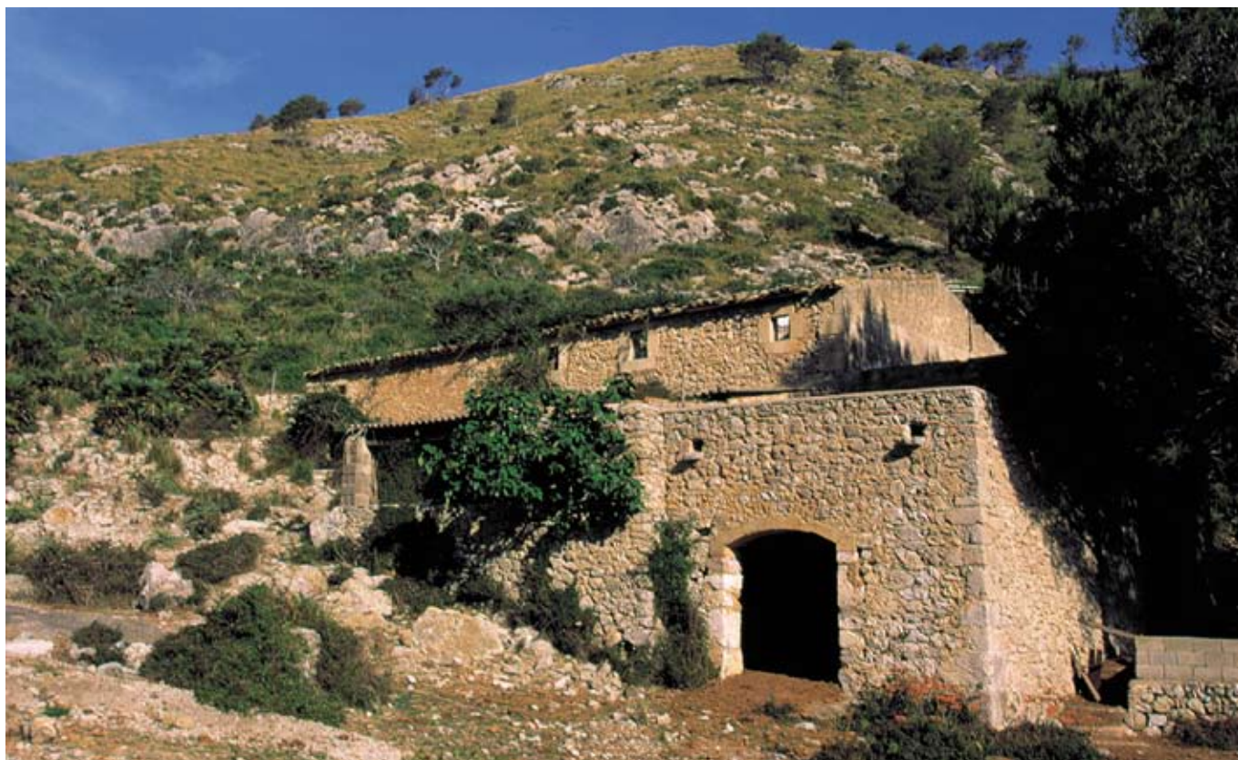
Les cases des Verger

Paral·lelament al camí podem veure un tallafoc obert per les brigades que realitzen tasques de prevenció dels incendis forestals; la pastura dels ramats complementa aquestes actuacions.