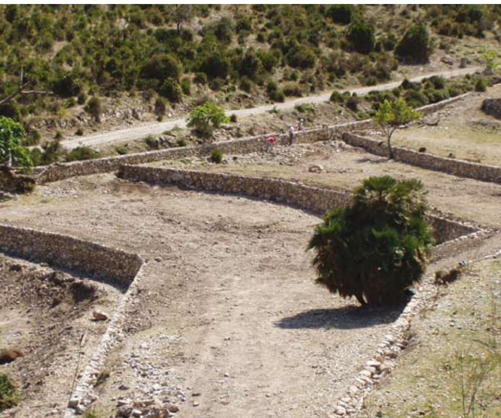
Marjades des Verger

La construcció de marges, parets, fonts i canalitzacions comporta la creació d'hàbitats que colonitzen espècies com els invertebrats, que troben dins els murs de pedra un ambient amb condicions estables, a resguard dels depredadors.