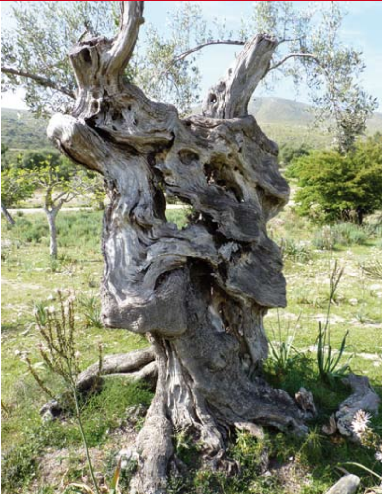
Olivera centenària

Seguint la nostra ruta travessam l'olivar de ses Monjoies i una zona d'alzinar fins arribar a l'encreuament amb el camí procedent de Son Puça. Penjades de les oliveres hi ha trampes de fosfat per a prevenir la plaga de la mosca de l'olivera.