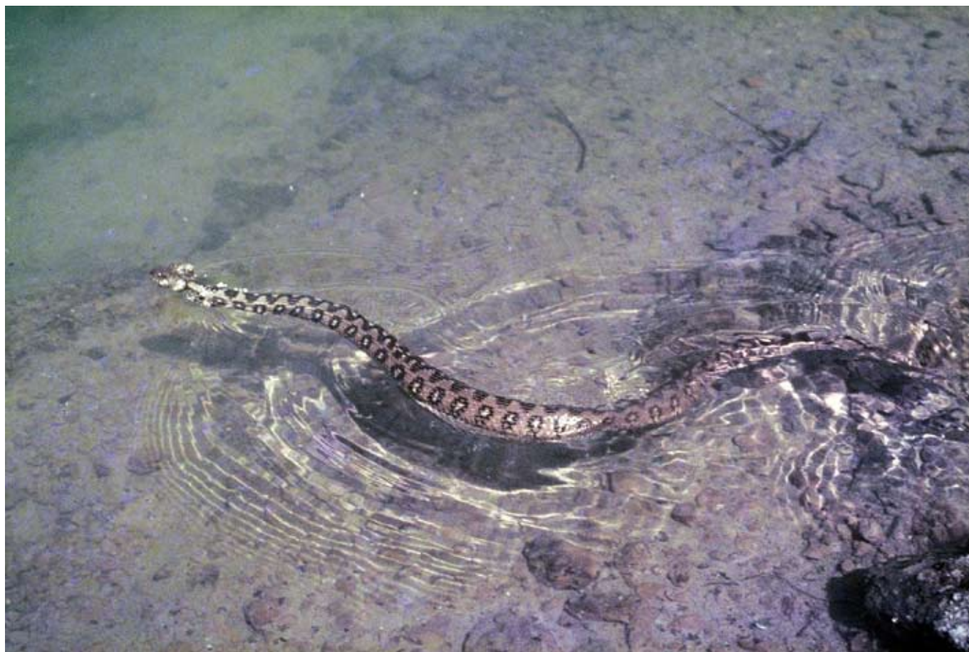
Serp d'aigua

A l'estiu, quan l'aigua escasseja, el safareig es converteix en un centre de vida. Les fonts, safarejos i basses del Parc es netegen regularment per a mantenir-los en condicions adequades. El seu abandonament suposaria la desaparició d'aquest petit ecosistema.